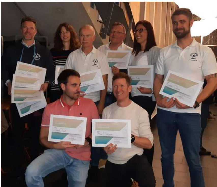
Ci-dessus à gauche: cérémonie de la remise des mérites sportifs organisée par la Ville de Neuchâtel, durant laquelle les compétitrices et compétiteurs de la SNN ont été récompensés.e.s.